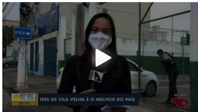
Ifes liderou classificação das melhores notas no Enem entre os institutos federais