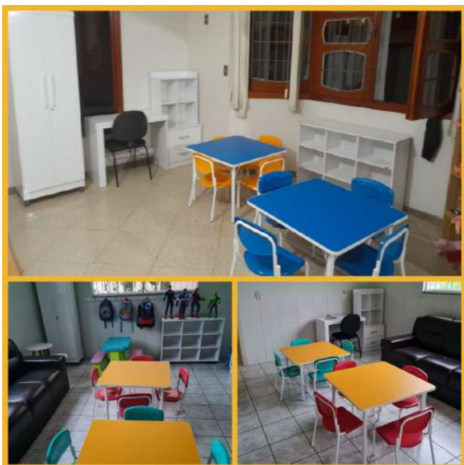
Ilustração do local com mobília e equipamentos adquiridos

Entre as atividades realizadas, os alunos participaram: do Desafio E-Conomy Simulator, um jogo sobre economia criado por alunos do curso de Sistemas de Informação; do 2º Concurso de Fotografia cujo tema foi “100 Anos de Colatina e suas empresas e o processo de inovação tecnológica”; e do Hackathon de Administração, uma jornada que visa a proposição de soluções para o desafio proposto (“A Digitalização do Centro de Integração Empresa – Escola do Ifes campus Colatina”).