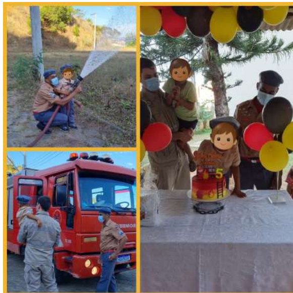
Ilustração do aniversário com a presença do Corpo de Bombeiros