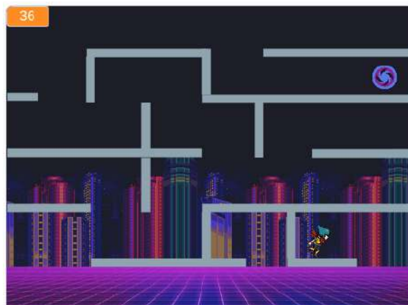
Ilustração de um dos jogos desenvolvidos pelos alunos

nos alunos e promover uma formação inicial na área de programação de computadores. Tal curso ofertou 20 (vinte) vagas, foi realizado de maneira semi-presencial e com carga horária total de 60 horas, sendo composto por 3 módulos de 20 horas cada.