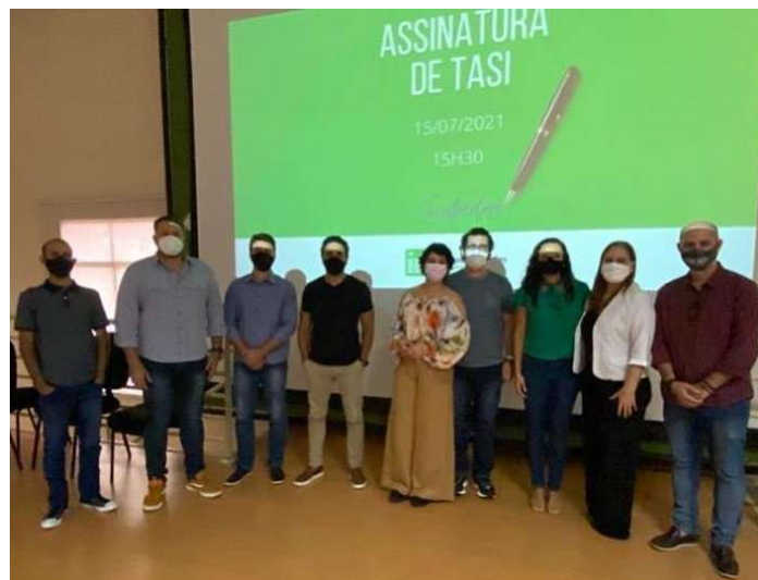
Registro da assinatura do Tasi

Em evento realizado em 15 de julho de 2021, as empresas assinaram o TASI – Termo de Adesão Simplificado. A partir dessa formalização, as empresas passaram a contar com os benefícios da incubação com atividades a partir dos seguintes eixos: empreendedor, tecnologia, capital, mercado e gestão. Além disso, os incubados residentes contam com a disponibilização de espaço físico do Campus Colatina, dentre outros apoios.