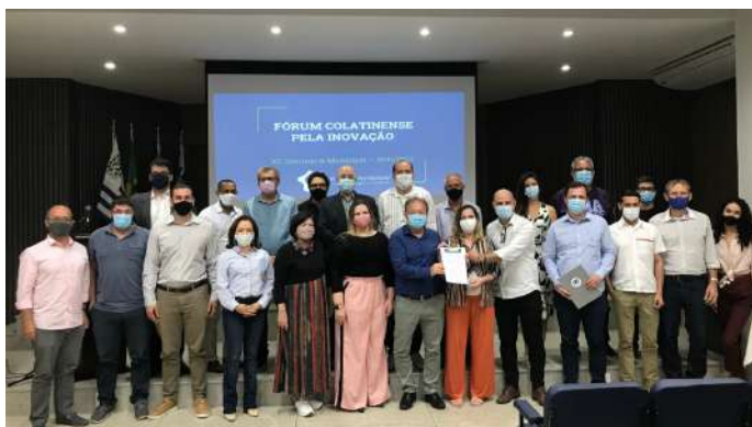
Participação da equipe do NIC no Fórum: Termo de Intenções Assinado.

Em suma, no ano de 2021, a Incubadora manteve-se como um ambiente de desenvolvimento empresarial, tecnológico e profissional que transforma ideias e projetos em produtos e serviços inovadores, por meio da execução de um planejamento anual. Para enfrentar os desafios e colocar o planejamento para rodar, o Núcleo contou com a seguinte equipe: