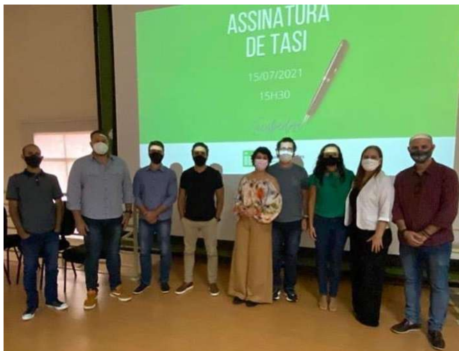
Cerimônia de assinatura dos Termos de Adesão Simplificados de Incubação com representantes do Núcleo Incubador Colatina, Direção do Campus e Empresas.

Neste Boletim DPPGE 2021, destacamos a iniciativa inédita de incubação de empreendimentos inovadores por parte do Núcleo Incubador Colatina (NIC). Com isso, 5 (cinco) empresas passaram a contar com o apoio e o suporte do campus Colatina em atividades relacionadas com tecnologia, gestão, capital e mercado, dentre outras. Com uma trajetória de 10 (dez) anos de existência, o NIC vem avançando para ampliar seu apoio e suporte a empreendimentos inovadores do município de Colatina e região, gerando emprego e renda aos cidadãos. Este foi um momento marcante para toda a nossa Comunidade Acadêmica do Ifes campus Colatina.