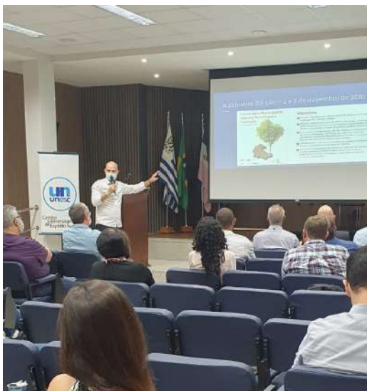
Participação da equipe do NIC no Fórum: Histórico do Seminário Municipal de CT&I

empreendedorismo, pesquisa e inovação do município Colatinense assinaram o termo de intenções, incluindo o Ifes - Campus Colatina.