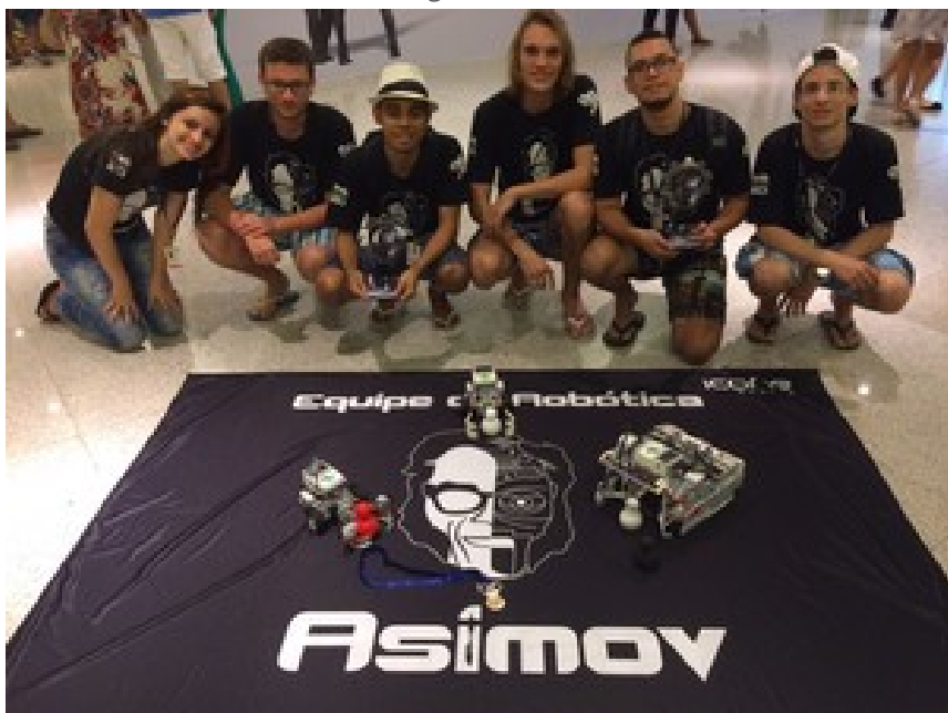
Equipe Asimov SEK

- Competição Robótica IEEE: que envolve a competição de robôs autônomos criados a partir de kits educacionais. Possui as sub-categorias: Standard Educational Kits (SEK, em que os alunos configuram robôs para salvar reféns em uma tragédia simulada), Open, Very Small Size e Humanoid Robot Racing.