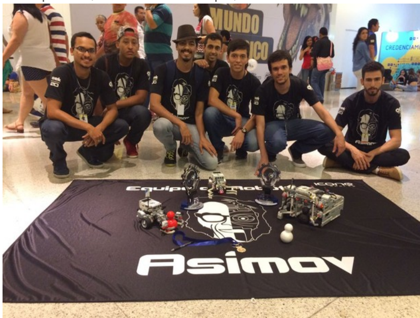
Equipe Asimov Futebol 2D

Estudante do campus Colatina venceram duas competições. Eles participaram, ao mesmo tempo, da LARC e da CBR.