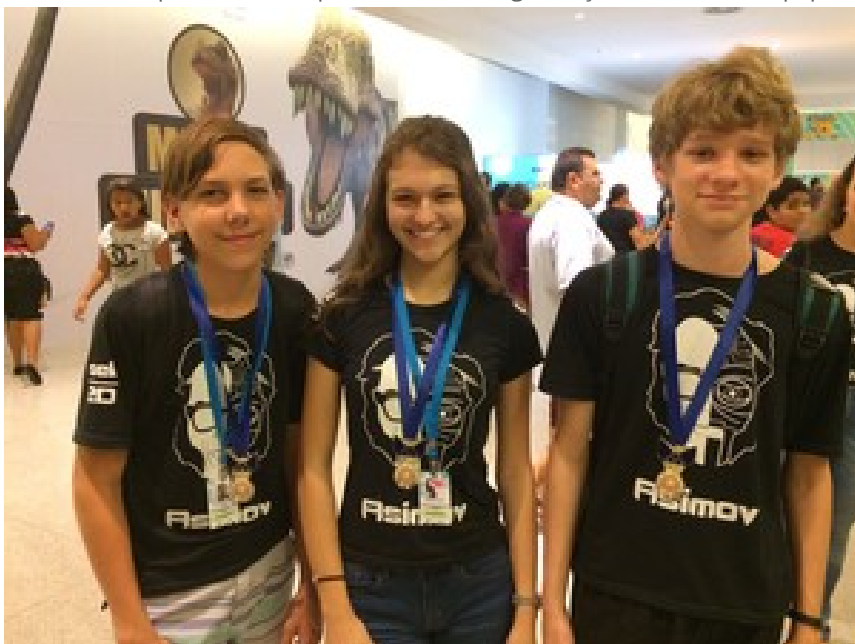
Equipe que participou da Olimpíada Brasileira de Robótica

As equipes puderam contar com o apoio, também, de Rosângela de Freitas, funcionária terceirizada do Campus Colatina, que auxiliou na organização interna das equipes.