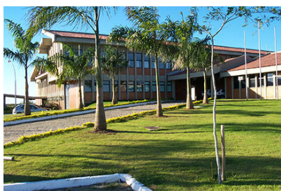
Campus Serra do Ifes oferece cursos de Automação Industrial e Informática.

Estão abertas as inscrições para os cursos técnicos do Instituto Federal de Educação do Espírito Santo (Ifes) até 16 de novembro. Para a unidade da Serra são 144 vagas para Automação Industrial e Informática. Ao todo, são 3.456 vagas distribuídas em 82 cursos nas modalidades integrados ao ensino médio, concomitante, subsequente e educação de jovens e adultos. As oportunidades são distribuídas nos 19 campi e estão detalhadas nos editais 01 e 02/2015.