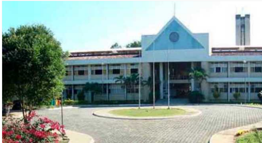
Folha Vitória Folha Vitória

O Campus do Ifes de Colatina vai realizar dois importantes cursos em parceria com a escola estadual Lions Clube no Bairro Moacyr Brottas.