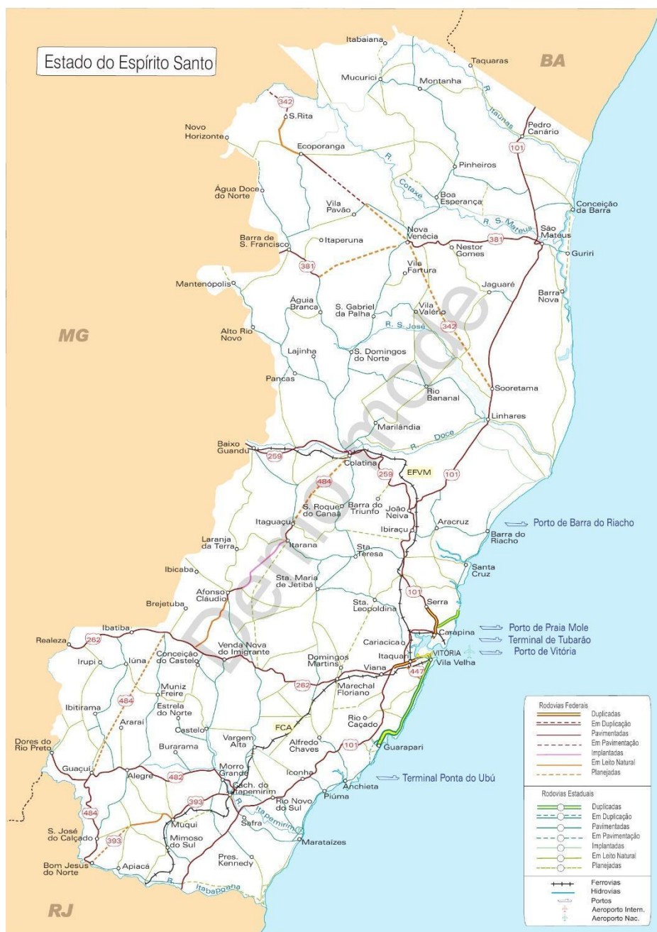
Figura 1 – Mapa Regional do Espírito Santo